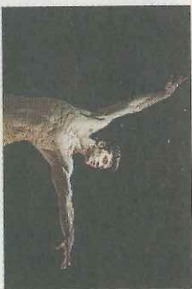
Oggi e domani All'Odeon, Space e Grotta di Sesto

della Danza» indaga con sapienza la vita «in tour» di Bolle e compagni, offrendoci non solo squarci sul lavoro rigoroso che si trasforma in poesia (negli illuminanti passaggi dalle prove all'esecuzione teatrale di celebri «passi»), ma finalmente un più vertiginoso story-telling di una carriera costruita