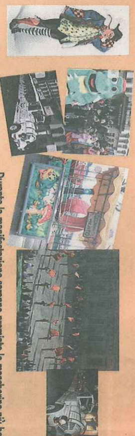
Durante la manifestazione saranno premiate le mascherine più belle.